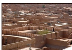
Oasenstadt Yazd

Treffpunkt 09:00 Lobby Hotel Moshir Garden, Fahrt nach Chakhmâgh Stadtspaziergang mit einem local guide