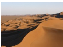
Dascht-e Kavir, Dascht-e Lut