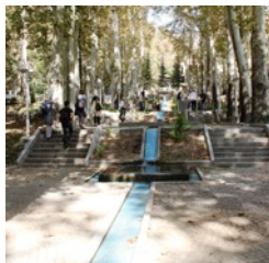
Niavaran Garten, Teheran

Mittagessen Naderi Café Treffpunkt 14:00 Bagh-e Melli