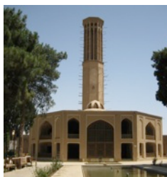
Bagh-e Dowlatabad, Yazd

Treffpunkt 14.00 Chakhmâgh, Fahrt nach Dowlatabad und Dakhmah