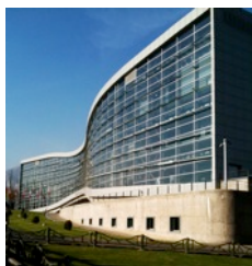
Mellat Park Cineplex, Teheran

Treffpunkt 08:30 Lobby Hotel Ferdowsi (mit Gepäck) Abfahrt 09:00 Stadtrundfahrt mit dem Bus