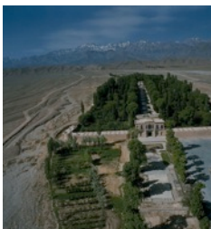
Bagh-e Shahzadeh, Mahan