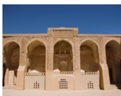
Freitagsmoschee, Na'in

Treffpunkt 09:00 Lobby Hotel Moshir Garden (mit Gepäck) Fahrt nach Isfahan mit einem local guide