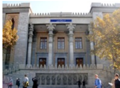
Aussenministerium, Teheran

Treffpunkt 09:00 Lobby Hotel Ferdowsi Fahrt mit dem Bus ins Stadtzentrum Stadtspaziergang mit einem local guide