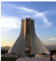
Freiheitsturm Turm, Teheran, Foto: Hosna Pourhashemi