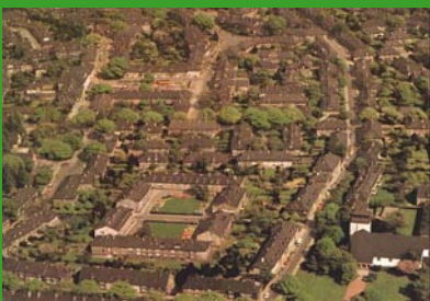
Gartenstadt Margarethenhöhe, Foto: www.essen-margarethenhoehe.de