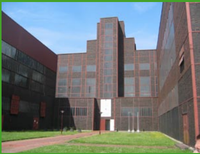
Zeche Zollverein

Der Tetraeder, zusammengesetzt aus Stahlrohren und Gussknoten, ist ein Symbol für den Strukturwandel in der Region.