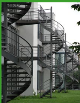
Wissenschaftspark Gelsenkirchen

Samstag, 19. April 2008 8:30 Uhr Abfahrt vom Hotel