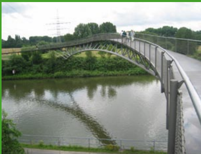
Emscher bei Haus Ripshorst

Der Essener Industriekomplex (Weltkulturerbe) ist ein Beispiel für ein nachhaltiges Entwicklungskonzept, das sich u.a. durch attraktive Freizeitangebote und die Ansiedlung von Kreativunternehmen auszeichnet.