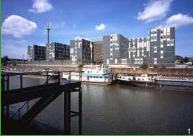
Innenhafen Duisburg

Donnerstag 17. April 2008 Anfahrt bzw. Anflug: individuell