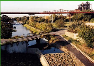
Landschaftspark Duisburg Nord

Entwicklung eines neuen Stadtgebietes mit einem ausgewogenen Nutzungsmix auf einem ehemaligen Hafengelände (Master- plan Norman Foster+Partner).