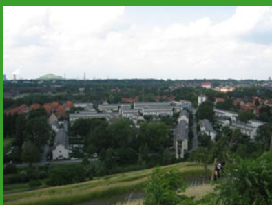
Siedlung Schüngelberg

Info- und Stadtteilzentrum, Bibliothek, Bürger-saal, Solarenergie- und Grubengasnutzung.