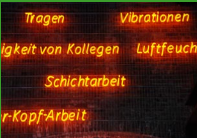
Rheinisches Industriemuseum Ober- hausen

Eine 200 Hektar große Industriebrache wurde zu einem Multifunktionspark neuen Stils um- gestaltet (Planung: Peter Latz und Partner).