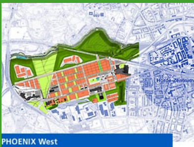
Zukunftsstandort Phoenix