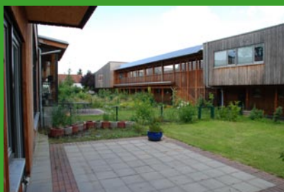
Solarsiedlung Bismark

Der „Wissenschaftspark“ ist eines der größten Projekte der IBA Emscherpark und soll der vom Niedergang der Montanindustrie wirtschaftlich wie städtebaulich gezeichneten Stadt neue Perspektiven geben.