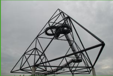
Tetraeder Bottrop