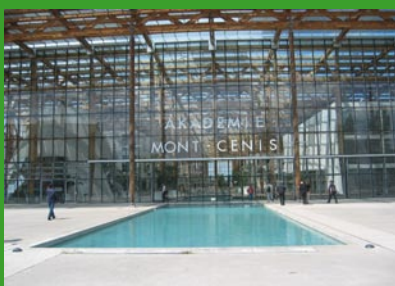
Monte Cenis

11. Station Fortbildungsakademie Monte Cenis, Herne